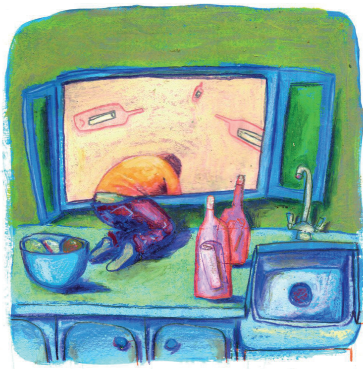
Illustrations oréli Paskal • Mise en page Poil aux Dents